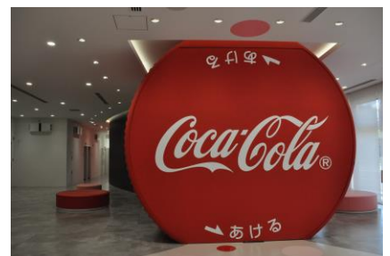
コカコーラノ製造工程体感