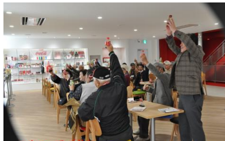
コカコーラで乾杯