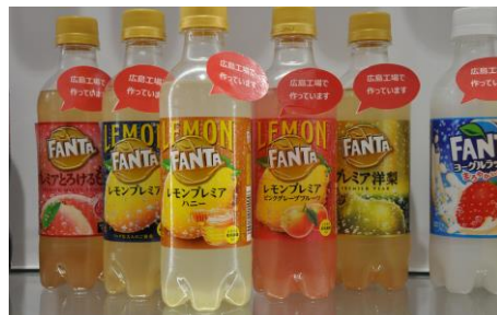
コカ・コーラボトラーズ飲料の一部