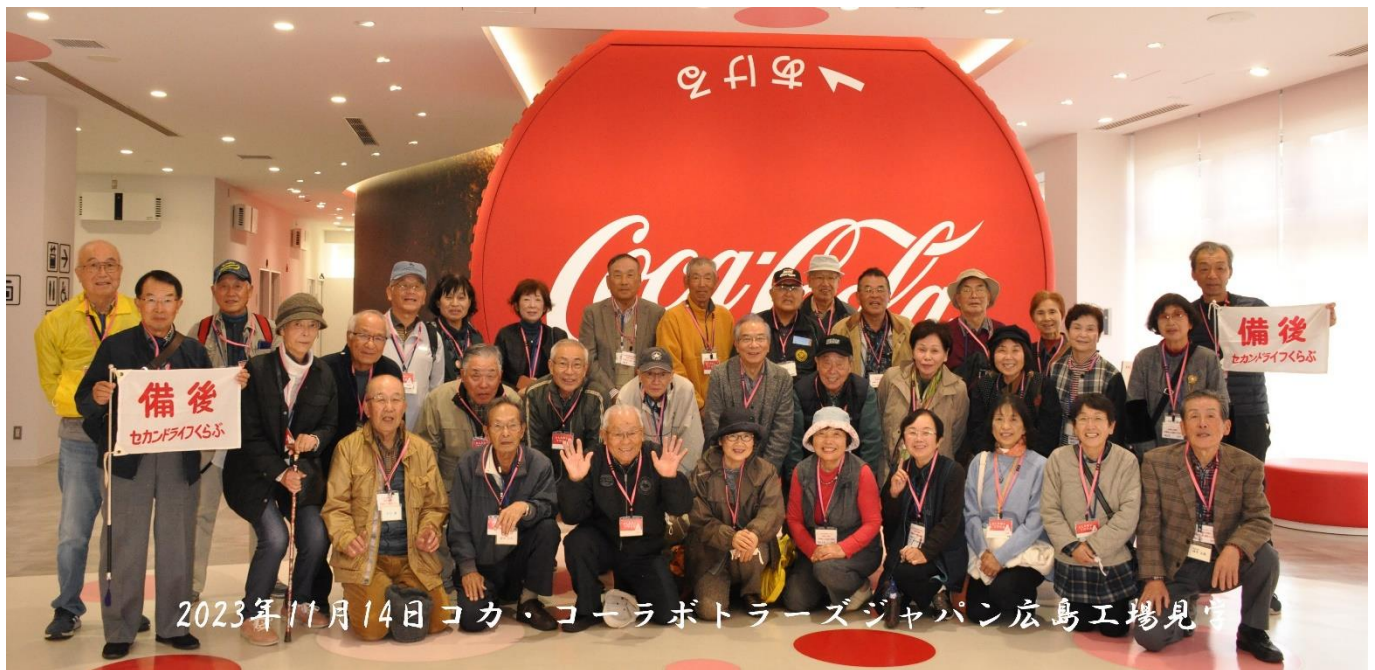
2023年11月14日 コカ・コーラボトラーズジャパン広島工場見学

コカ・コーラボトラーズは本郷工場が 2018年 7月豪雨で浸水被害を受け、近くに新築移転して新しく広島工場が 2020年 6月に操業開始しました。当工場は従来の製造工程を見るだけでなく見学者が製造工程を体感できるようになっていました。広島工場の製品はコカコーラの他お茶（綾鷹・爽健・麦茶等）、コーヒー、炭酸・スポーツ・果汁飲料などで、表示記号はペットボトルキャップの横の賞味期限の後へ J で表示されています。見学案内係嬢に見送られて工場を後にして、トラブルもなく無事府中市経由で福山駅前へ帰着出来ました。